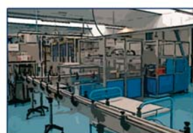
Lignes de fabrication